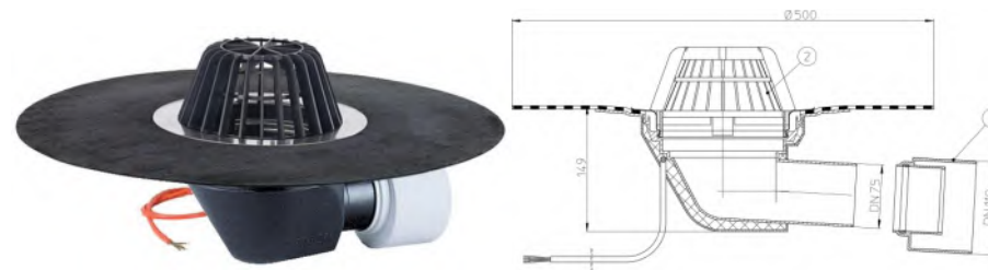
Рис. 1. Кровельная воронка с электрообогревом HL64.1H

Теплоотдача нагревательного элемента (соответственно и энергопотребление) линейно зависит от температуры окружающего воздуха: при +20°C - 13,30 Вт, при +10°C - 15,96 Вт, при +5°C - 17,10 Вт, при 0°C - 18,24 Вт, при -5°C - 19,0 Вт, при -10°C - 20,33 Вт, при -20°C - 22,42 Вт.